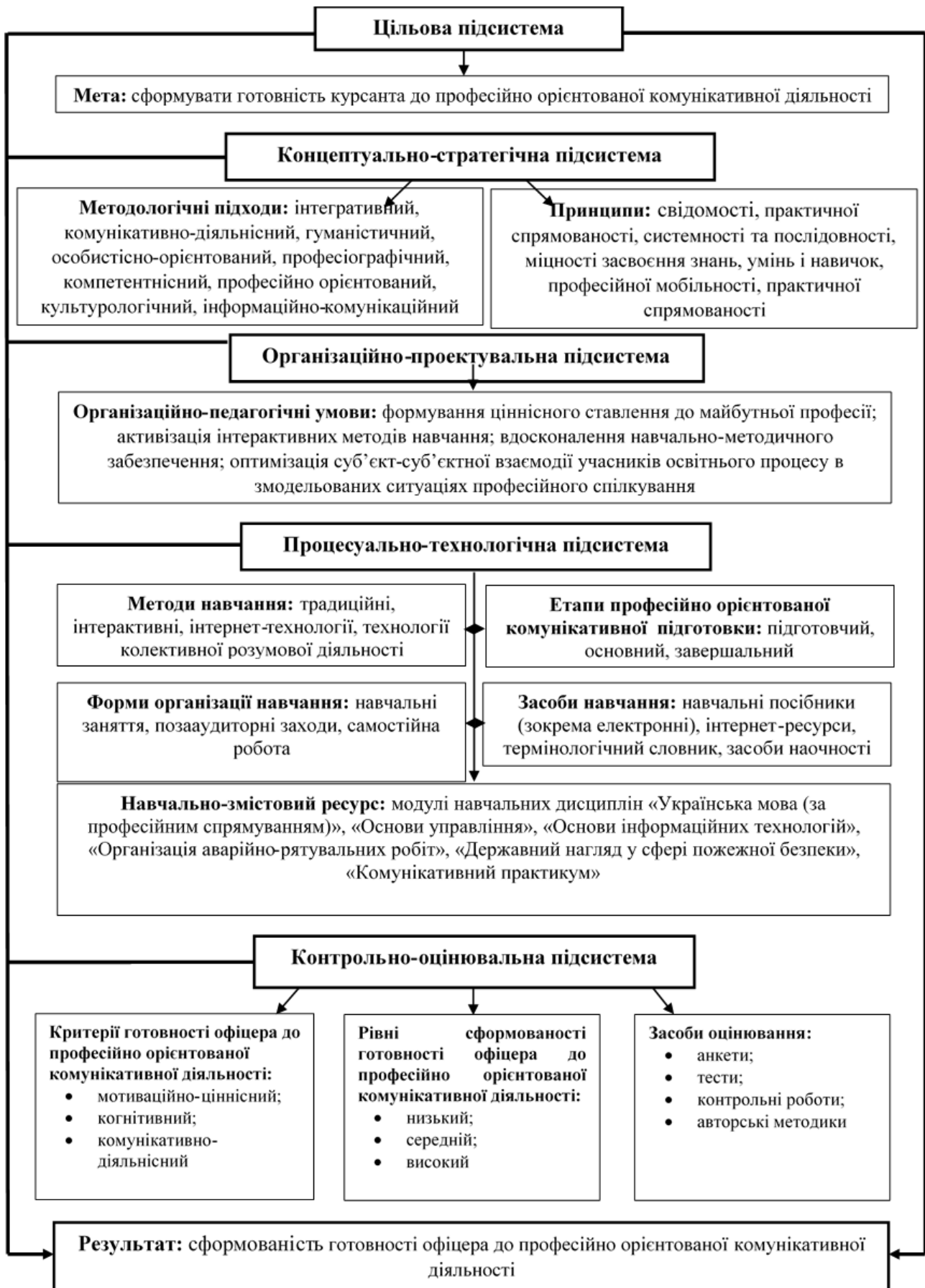
Рис. 1. Структурно-функціональна модель системи професійно орієнтованої комунікативної підготовки офіцера