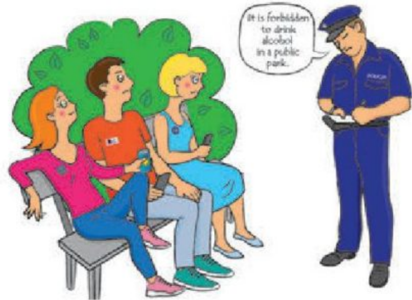
Різні країни, різні правила

Якщо ви завдали майнової шкоди третім особам, університету, зоні відпочинку, гуртожитку тощо, вам це доведеться відшкодувати перед виїздом з міста. Будь ласка, перевірте чи покриє ваша страховка такі випадки.