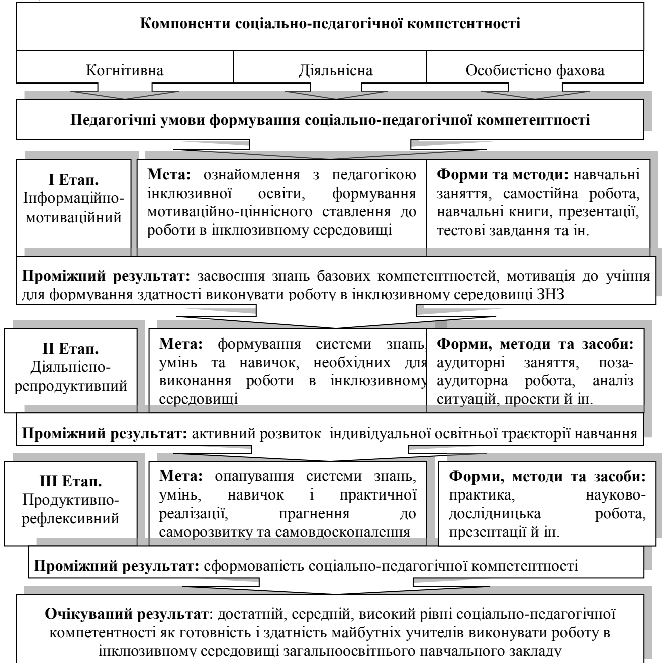
Рис. 1. Модель процесу формування у майбутніх учителів початкової школи соціально-педагогічної компетентності до роботи в інклюзивному середовищі ЗНЗ

На основі запропонованої професіограми обґрунтовано модель соціально-педагогічної компетентності майбутніх учителів початкової школи, на засадах якої розроблено модель процесу формування СПК до роботи в інклюзивному середовищі (рис. 1).